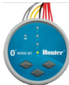
NODE-BT Durchmesser: 8,9 cm Höhe: 8,3 cm

Die Bluetooth® Wortmarke und Bluetooth® Logos sind registrierte Marken der Bluetooth SIG, Inc. iOS ist eine Marke oder registrierte Marke von Cisco Systems Inc. in den USA und weiteren Ländern. Android ist eine Marke der Google LLC. Die Nutzung dieser Marken durch Hunter Industries ist durch Lizenz gestattet.