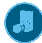
Freeze-Klik-Sensor Seite 152