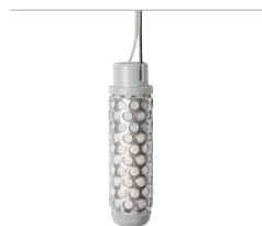
SC-PROBE Bodenfeuchtigkeitssensor Durchmesser: 2,5 cm Höhe: 8,3 cm Entfernung zwischen Steuergerät und Sonde: 30 m Maximum 1 mm 2 Aderdurchmesser